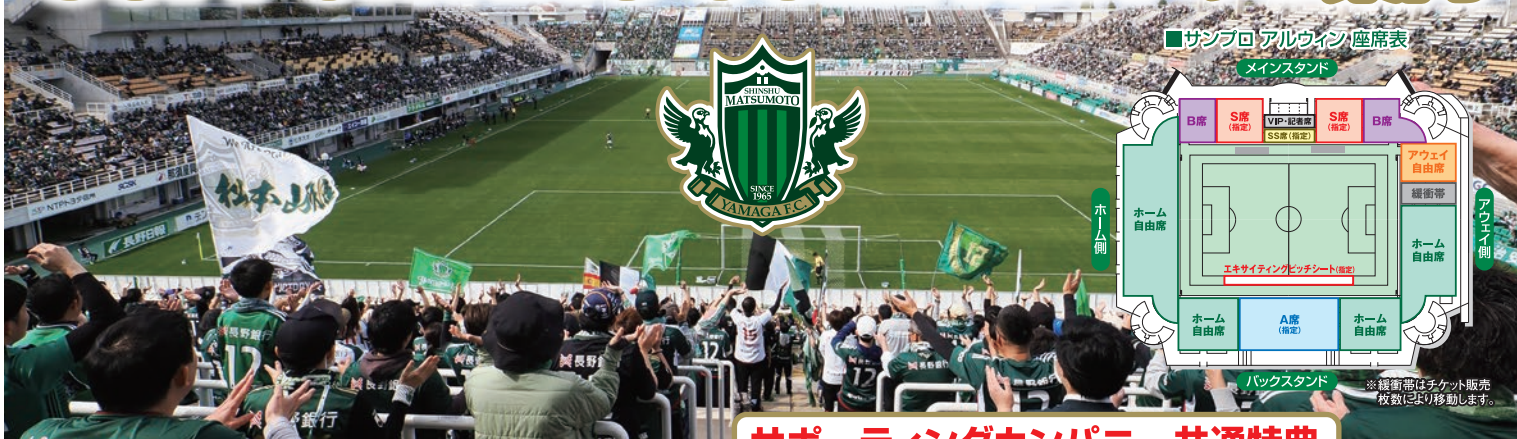
■サブプロ アルウィン 座席表 メインスタンド