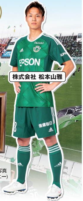
株式会社 松本山雅